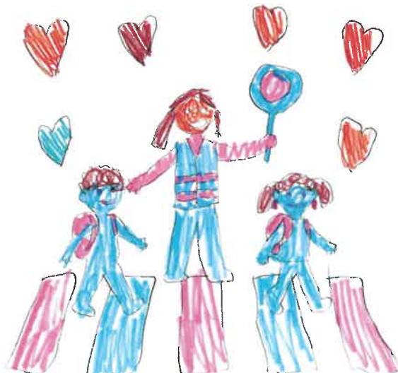
Dessin d'une écolière de Burtigny

✉ a.handley@burtigny.ch — ☎ 079 706 43 03 — ou à l'administration communale.