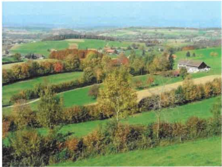
A gauche, allée d'arbres ; à droite, haies