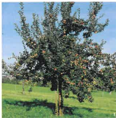
A gauche, verger ; à droite, arbre fruitier haute tige