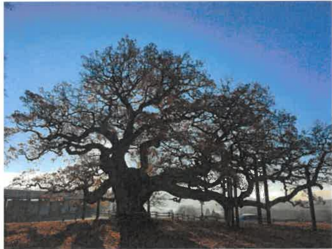
A gauche, arbre isolé ; à droite : arbre remarquable (chêne de Morrens)