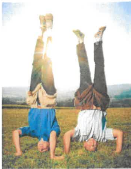
Les deux hommes n'ont pas grandi dans le coin. Ils s'y sont mis « pour les copains et la tradition. »

Une infection qui tombe mal Bien décidés à profiter à fond de cette fédérale des jeunes qu'ils ne disputeront qu'une